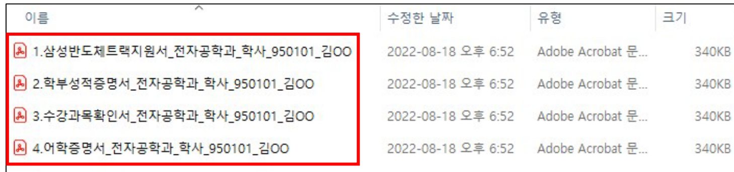
[그림 1] 파일형식 및 파일명 예시